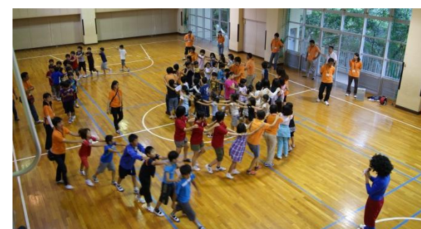
じゃんけん列車で遊んだよ