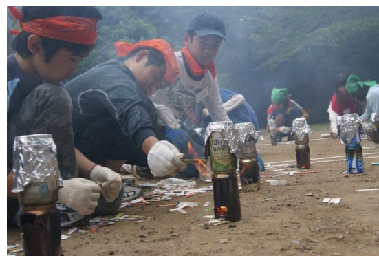
おいしく炊けるかな？

いちかわ子ども村は、青少年相談員が主催する、夏休みに自然の中で行われる1泊2日のキャンプです。市川市大町にある「少年自然の家」で、いろいろなことにチャレンジしました。