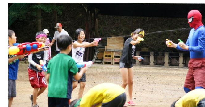
にせスパイダーマンをやっつけろ！

※事前に参加の申し込みが必要です。6月頃に市の広報や学校からのお知らせで募集するので、おうちの人に申し込んでもらってね。