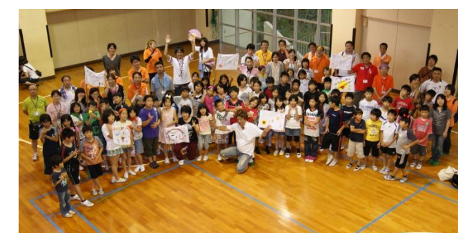
いっぱい友達できたよ！！