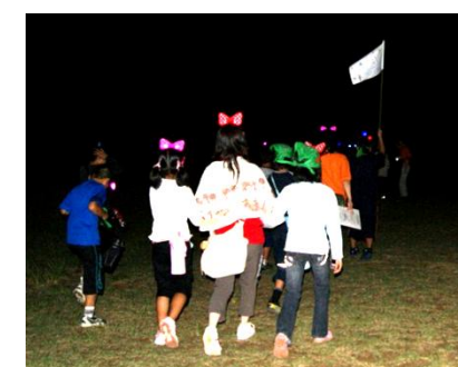
仲間がいるから怖くないぞ！

2日目は水遊びで、みんなずぶ濡れでした(笑) 仲良くなった友達やボランティアで参加してくれた高校生のお姉さん、お世話になった相談員と、バイバイするのはつらかったよね。