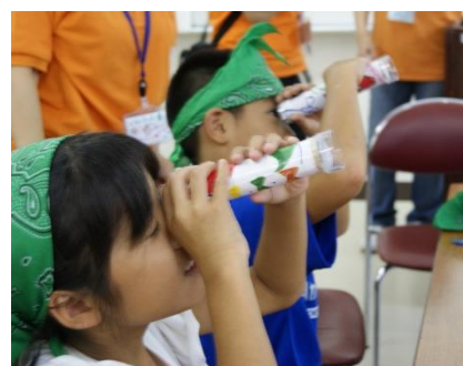
みんなで万華鏡作り

1日目は体操のアフロお兄さんとの楽しいゲームから始まり、キレイな万華鏡作り、空き缶で作るご飯やカレーでお腹をいっぱいにした後に待っていたのは、ドキドキ、ワクワクのナイトウォーク！